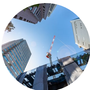
上空視界の狭い 都市部工事